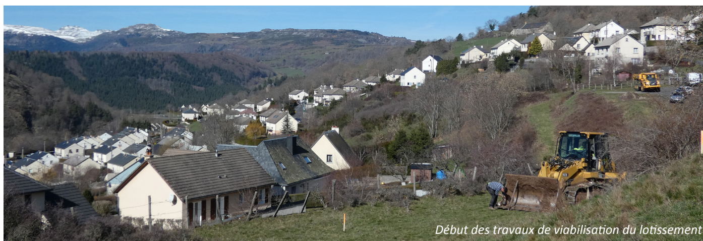
Début des travaux de viabilisation du lotissement

L'objectif étant d'inciter de jeunes actifs, et si possible de jeunes couples avec enfants, les élus ont en outre fait le choix d'aménager une micro-crèche et un jardin d'éveil au centre Léon Boyer (travaux en cours, achèvement prévu en juin prochain). Si le coût de l'investissement de ce nouveau service est amorti à 80 % par la Caisse des Allocations Familiales, la Protection Maternelle et Infantile, la Mutualité Sociale et Agricole et par le programme Leader , le coût de son fonctionnement, aussi partagé, mais loin d'être négligeable, viendra alourdir la charge de la commune d'environ 30.000,00 € par an.